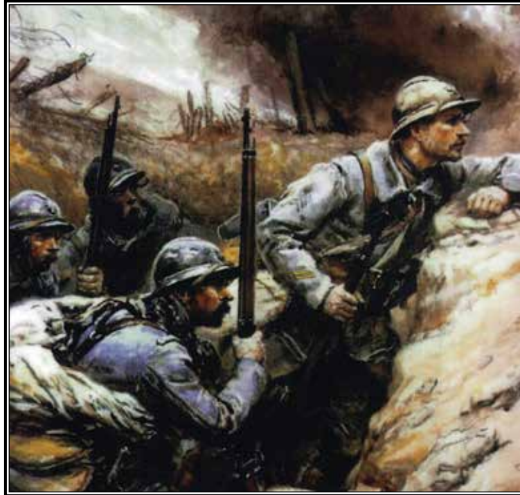
Le sous-officier de Verdun avec ses Poilus dans la tranchée avant l'assaut